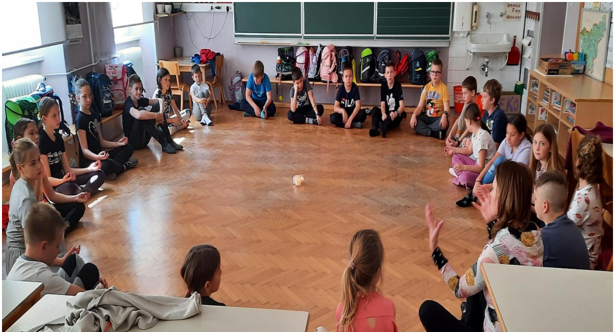
Z jogo smo se raztegnili, na koncu pa smo uživali še v zvočni kopeli.