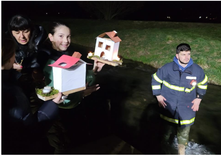
Prižgemo lučko – svečko in gregorčka spustimo po vodi.