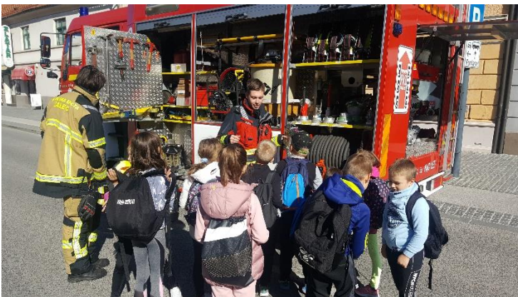
PREDSTAVITEV OPREME, PRIPOMOČKOV