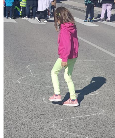
GIBANJE JE ZDRAVO