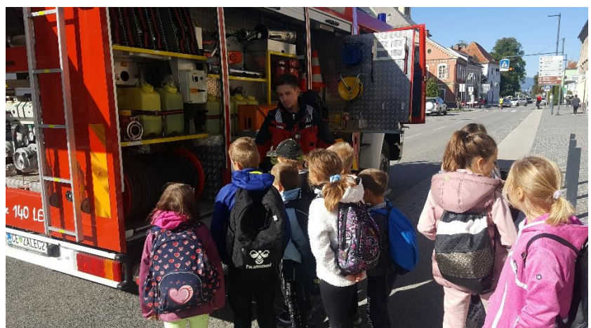
IN DELA POLICISTOV IN GASILCEV