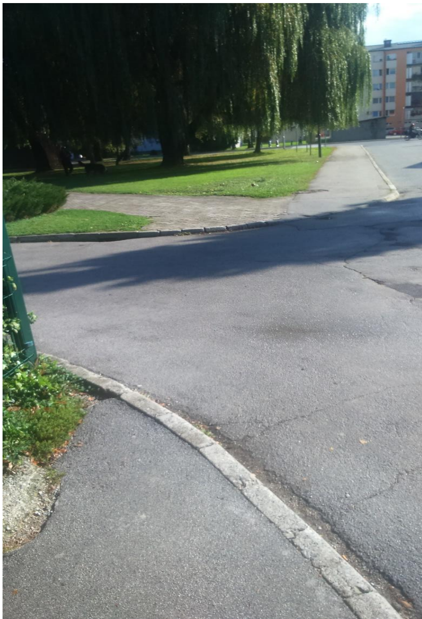
Fotografija št.4: Šilihova ulica – Ni prehoda za pešce, ko gredo po pločniku in naprej po potki proti garderobi šole.