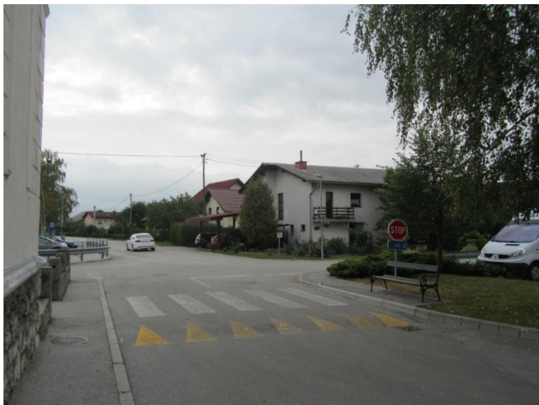
Fotografija št. 18: Pločnik oziroma cesta na obeh straneh ob šoli; starši tu večkrat parkirajo svoje avtomobile.