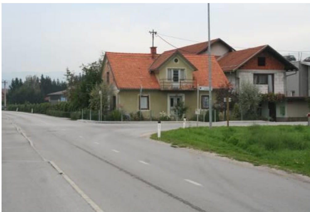
Fotografija št.12: Vrbe – križišče Ceste na Vrbe in ceste Žalskega tabora – nepregleden del cestišča