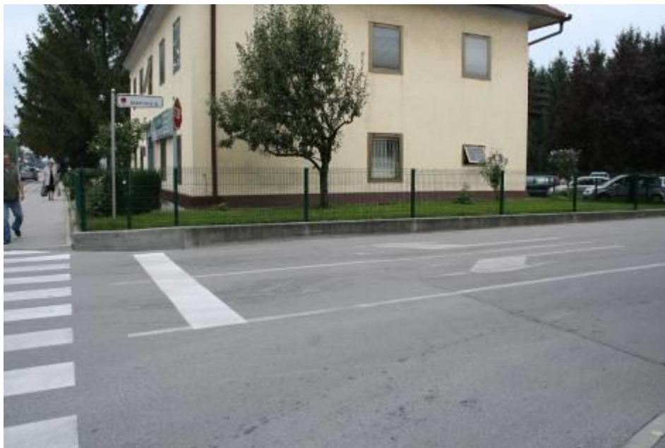
Fotografija št. 7: Križišče Aškerčeve in Savinjske ceste (pri foto Rizmal) ni pločnika