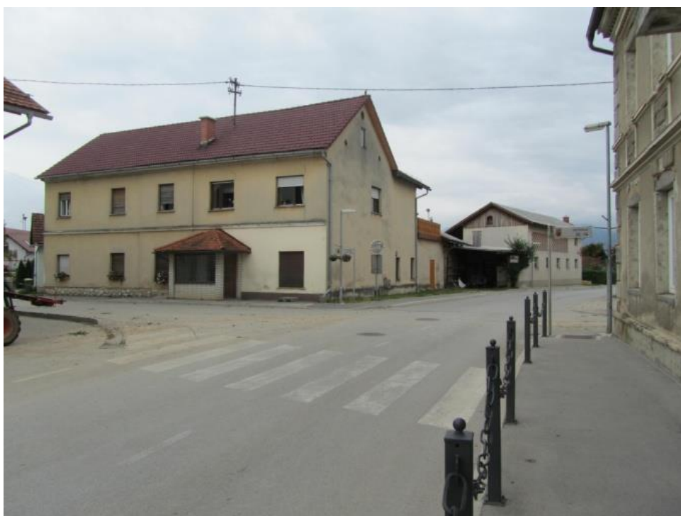
Fotografija št. 24: Neoznačen prehod čez cesto (proti stavbi Rožičevih)