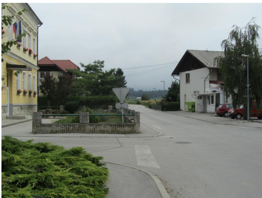
Fotografija št. 19: Križišče ob šoli; vozila pripeljejo iz štirih smeri.