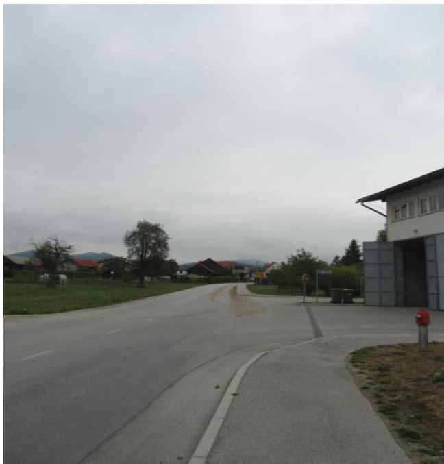
Fotografija št. 25: Neoznačen prehod čez cesto (pri skladišču trgovine Aliansa)