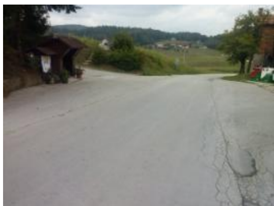
Fotografija št. 26: Avtobusno postajališče Studence na cesti V. Pirešica – Velenje.

Vse poti, razen strogega vaškega jedra, ki učence vodijo do šole na Ponikvi pri Žalcu so nevarne poti. Ob cesti ni pločnika in razsvetljave, na cestah ni zarisanih prehodov za pešce, prometnih znakov je veliko premalo, da bi voznike opozarjali na prisotnost otrok na cestah.