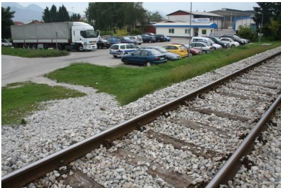
Fotografija št. 9: Nezavarovan prehod čez železniško progo v Vrbju