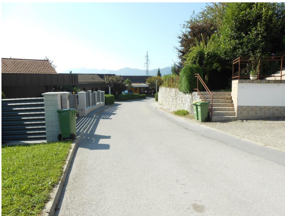
Fotografija št. 15: Soseska Podvin- Škafarjev hrib – na več mestih v naselju so na obeh straneh ceste škarpe, pločnika pa ni.