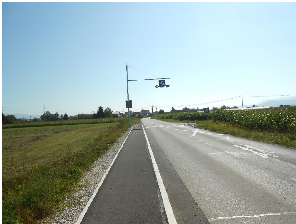
Fotografija št. 1: Na novo zgrajen pločnik in označen ter osvetljen prehod za pešce čez cesto Žalec - Velika Pirešica

Učenci od 2. do 9. razreda iz Gotovelj, Ponikve ter iz Ložnice, ki stanujejo ob obvoznici, prihajajo v centralno šolo s šolskim avtobusom. Upravičenih do prevoza s pogodbenim avtobusom je 105 učencev na centralni šoli ( stanje na dan 1. 9. 2019 ). Učenci iz zaselka Soseska Podvin - Škafarjev hrib in Ložnica imajo na podlagi sklepa Sveta za preventivo in vzgojo v cestnem prometu Občine Žalec, ki smo ga prejeli 15. 4. 2015 do I. OŠ Žalec varno pot. Od mostu čez Ložnico (pri Rozmanu) je na novo zgrajen pločnik do označenega in osvetljenega prehoda za pešce čez cesto Žalec – Velika Pirešica, od koder je urejena asfaltna pešpot do soseske Podvin, nato gredo skozi sosesko Podvin čez nadvoz »Mavrica« do I. OŠ Žalec.