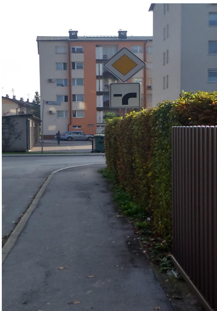
Fotografija št. 6: Šilihova ulica – zaradi žive meje nepregleden del cestišča.