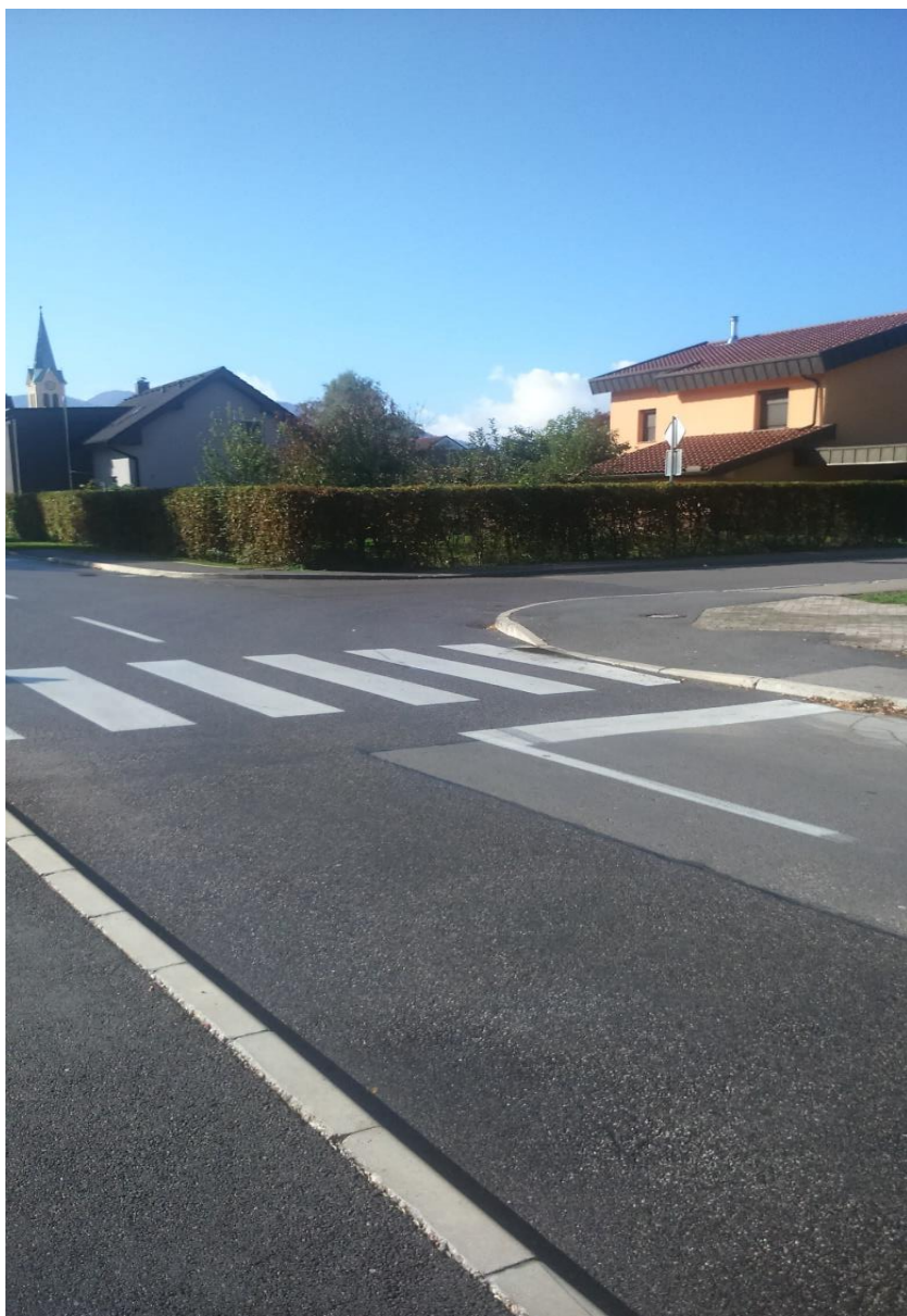
Fotografija št. 5: Šilihova ulica – zaradi žive meje nepregleden del cestišča.