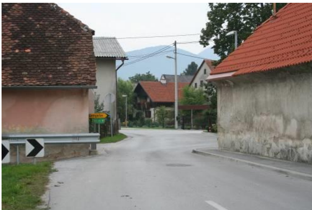
Fotografija št. 10: Vrbje – zožanje ceste, pločnik se zaključí