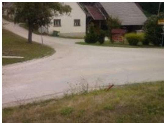
Fotografija št. 28: Smer Ponikva šola – Kale, z odcepom (asfalt. poljska cesta) s povezavo na glavno cesto V. Pirešica – Velenje.