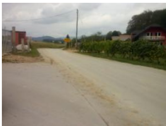
Fotografija št. 27: Cesta V. Pirešica – Velenje, z odcepom (asfalt. poljsko cesto) s povezavo na cesto Ponikva šola – Kale.