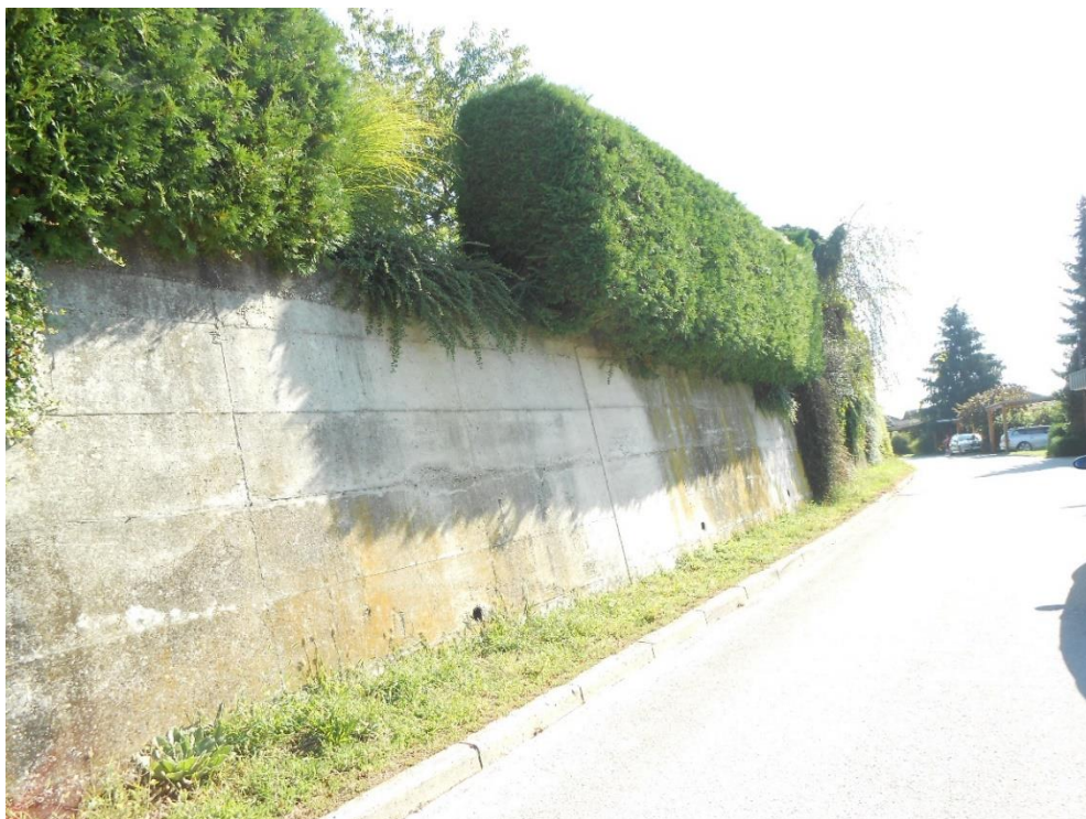
Fotografija št. 16: Soseska Podvin- Škafarjev hrib – Visoka škarpa ob cesti ovira vidljivost