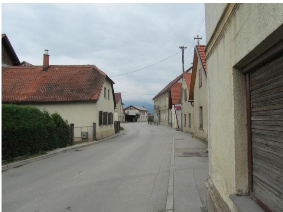
Fotografija št.22: Zožanje pločnika (pri domačiji Antloga), takoj za stavbo izvoz z dvorišča