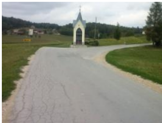
Fotografija št. 29: Cesta V. Pirešica – Velenje z odcepom za zaselek Marof.

Prav zaradi nevarnih šolskih poti, učence vozi v šolo in iz nje šolski kombi, ali pa to opravljajo njihovi starši. Z učenci se sicer vsako leto, predvsem največ na začetku šolskega leta, o prometni varnosti pogovorimo in poti v kraju tudi prehodimo. Zavedamo se, da otroci te poti vendarle prehodijo, če že ne na poti v in iz šole, pa v prostem popoldanskem ali počitniškem času. Ker je njihova varnost naša največja skrb, se zavedamo, da noben napotek v zvezi z varnostjo v cestnem prometu nikoli ni odveč.