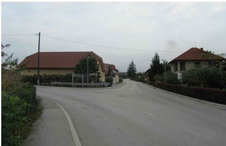
Fotografija št. 21: Križišče sredi naselja (pri domačiji Ribič); križišče cest s treh smeri