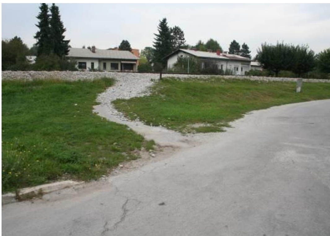
Fotografija št.8: Vrbje- nezavarovan prehod čez železniško progo