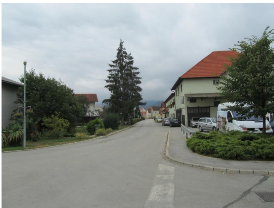
Fotografija št. 20: Pot ob cesti pri Zadružnem domu; parkirani avtomobili, pot za pešce le s črto ločena od parkirišč, na poti ovira (ograjen prostor)