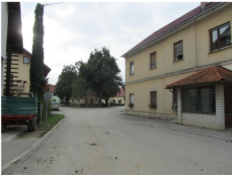
Fotografija št.23: Gotovlje; krožni promet in prečkanje cest