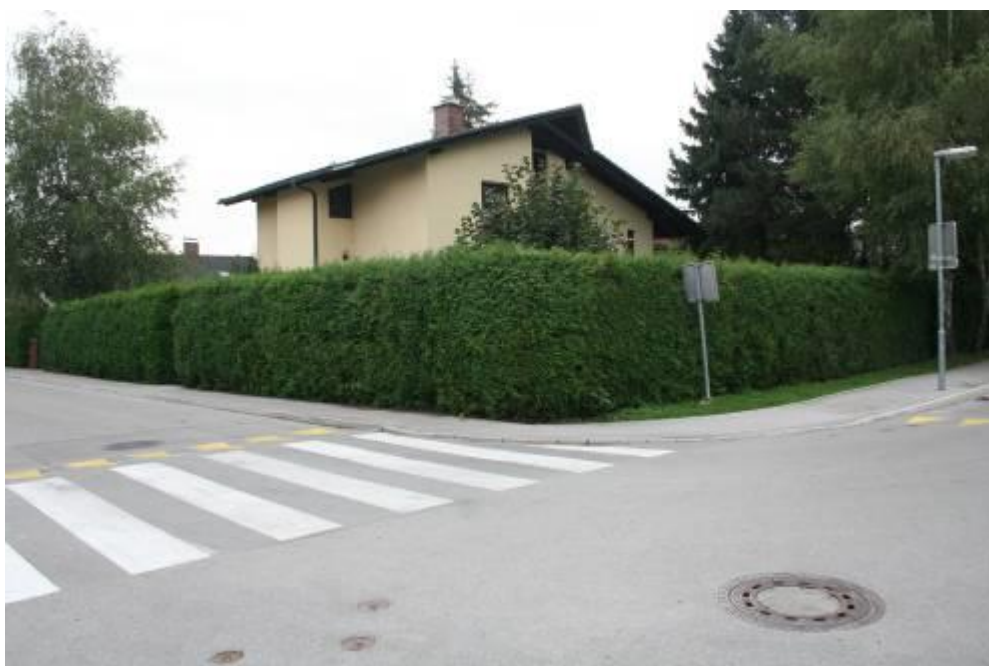
Fotografija št. 3: Šilihova ulica - Visoka živa meja ovira preglednost na delu, kjer otroci prečkajo cesto.