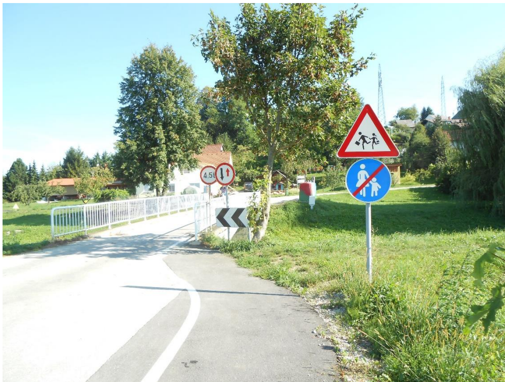
Fotografija št.13: Podvin – most čez Ložnico pri Rozmanu-ni označenih poti za pešce