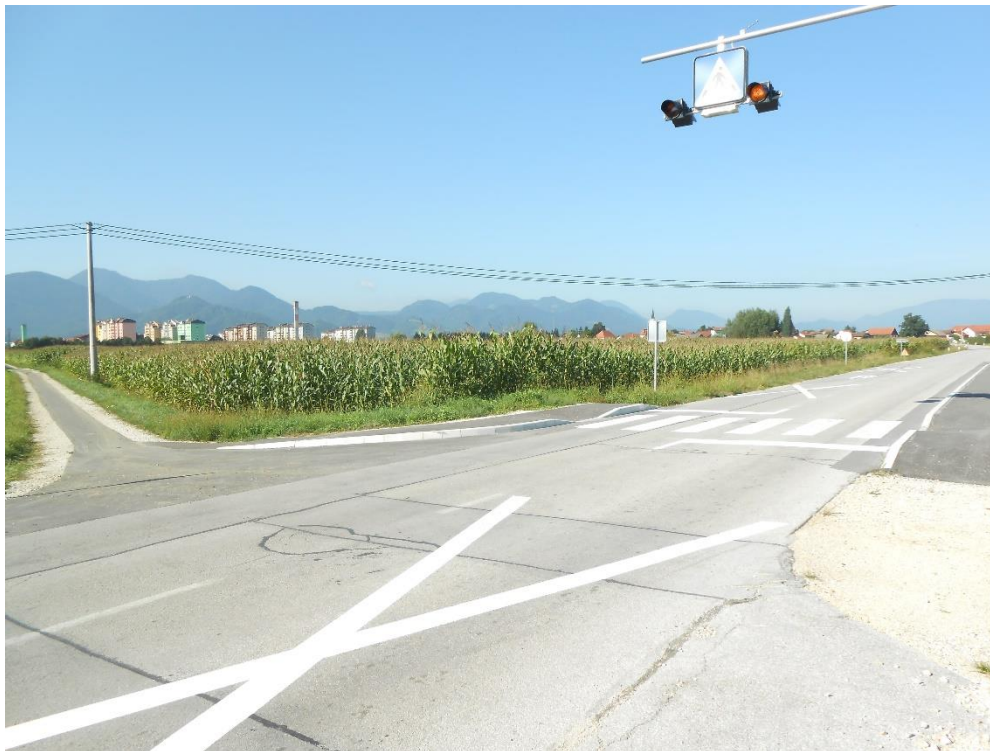
Fotografija št. 2: Asfaltirana pešpot do soseske Podvin in označen in osvetljen prehod za pešce čez cesto Žalec – Velika Pirešica

Številčni pregled učencev, ki obiskujejo centralno šolo , po ulicah in vaseh, od koder prihajajo (stanje na dan 1. 9. 2019):