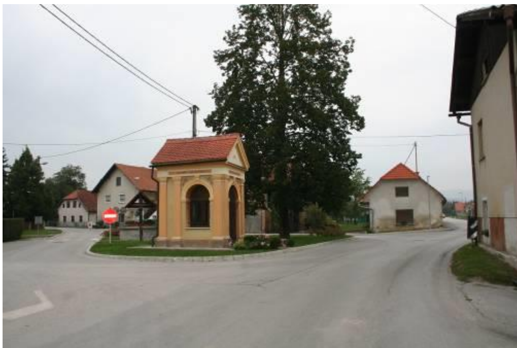
Fotografija št.11: Vrbe – krožni promet